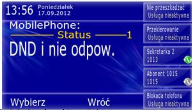
Funkcje dla połączeń i kontaktów